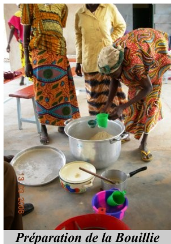
Préparation de la Bouillie

Les mamans viennent au CREN pour apprendre ce qui se fait de mieux, pour leur enfant en matière de sevrage.